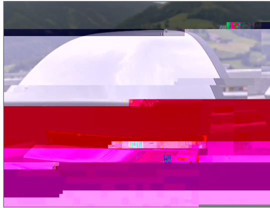
그림 3: 자동차 사이드 미러 시각화

시뮬레이션은 Synopsys의 Human Vision Tool은 Virtualization Module에서 사용되며, 사람의 눈이 인식하는 장면을 모니터에 시뮬레이션 결과로서 나타냅니다.